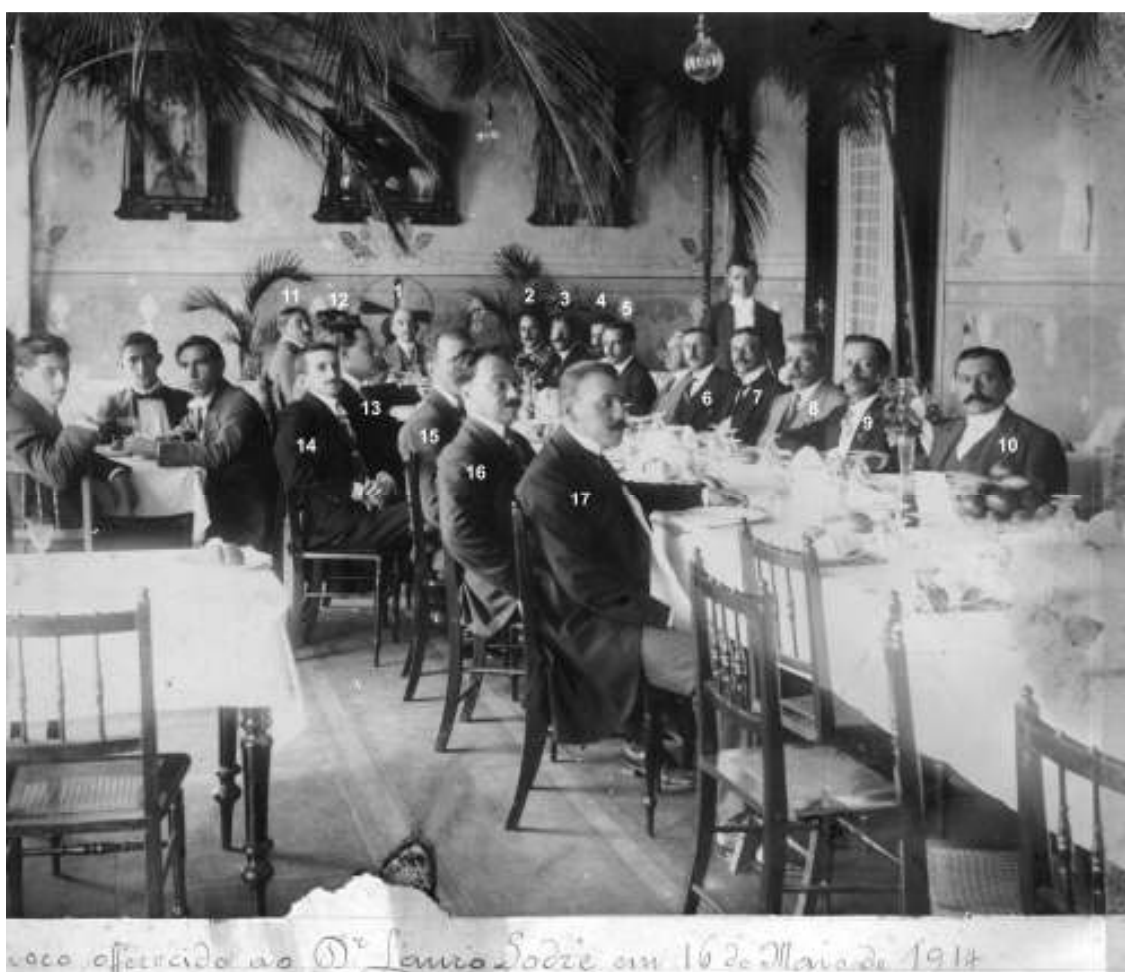
1- Dr. Lauro Sodré, Senador e Grão Mestre do G.O.B.